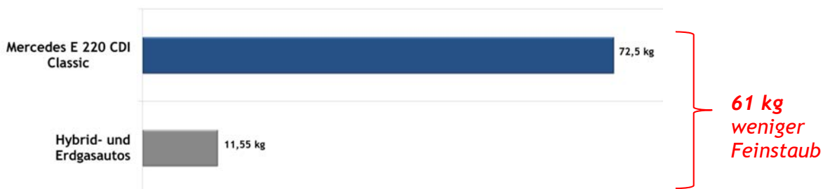
Abb. 1: Feinstaubproduktion - Vergleich Mercedes E 220 CDI Classic vs. Hybrid- und Erdgastaxis

Auf den 2,9 Millionen Kilometern, die diese Autos vom Datum der Zulassung bis zum 01.10.2013 bereits zurückgelegt haben, gab es wesentlich weniger Feinstaub-Emissionen, als wenn dieselbe Wegstrecke mit einem Mercedes E 220 CDI Classic (Baujahr 2006) bewältigt worden wäre.