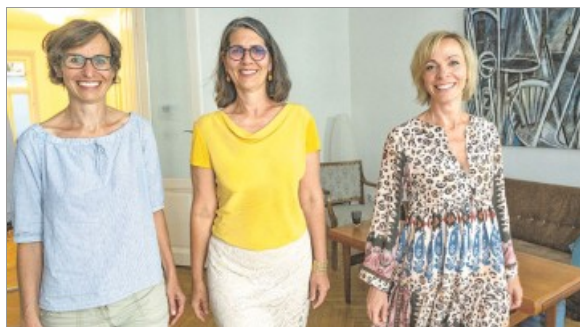
Kooperation mit Rückenwind