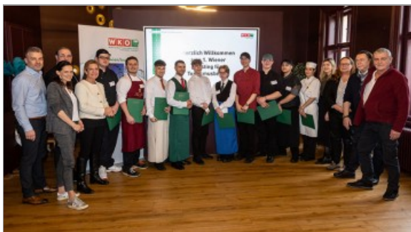
Der erste Schritt zum Staatsmeister