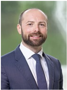
Mag. Erhard Scharl Ausbau und Einrichtung