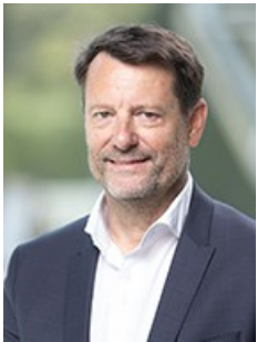
Mag. Wolfgang Hiegelsperger Fahrzeugtechnik