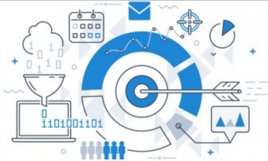
Chart of the Week

Ziele und Änderungen im Überblick ➤ mehr