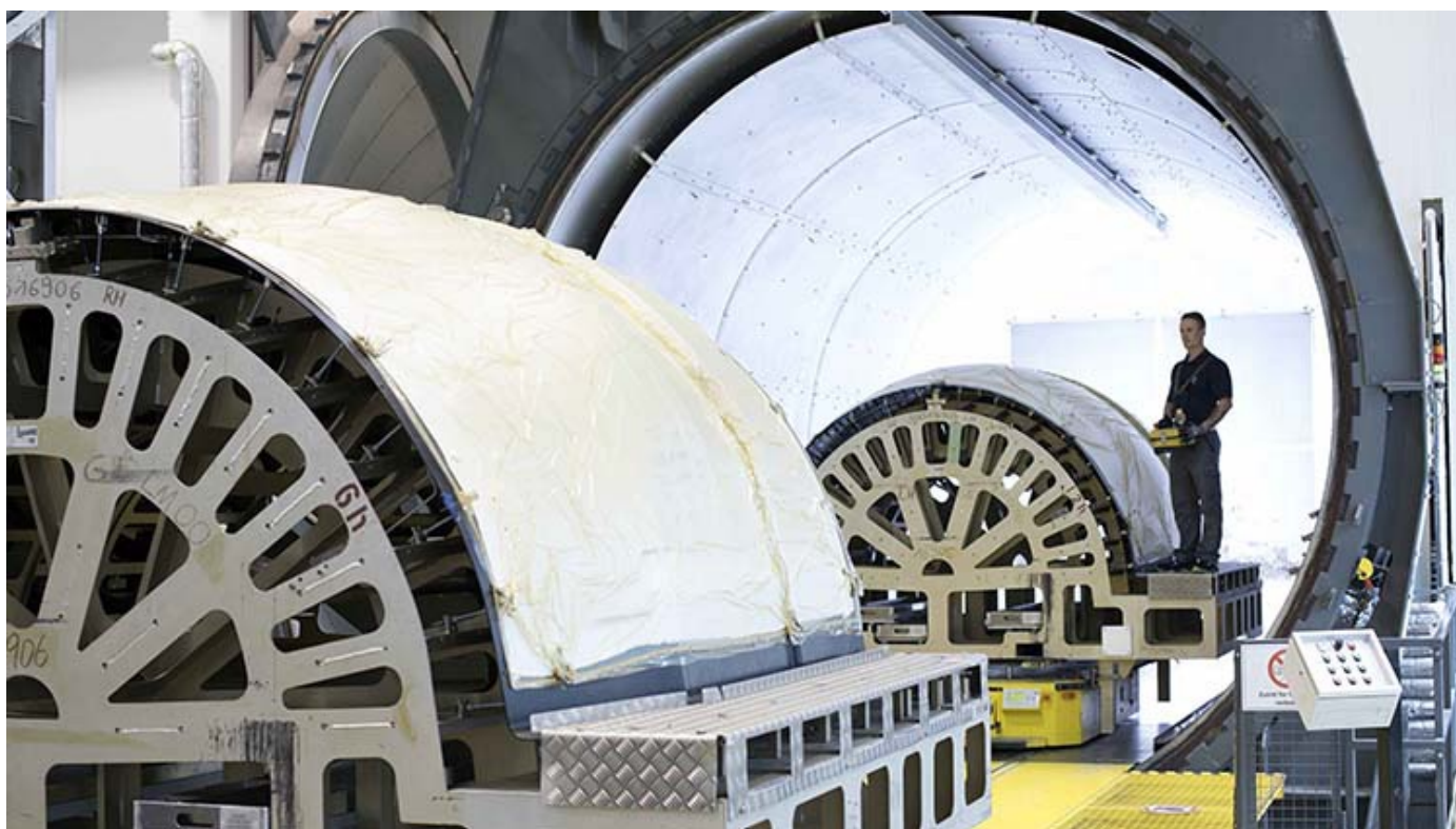
FACC-Produktion Reichersberg für Airbus A350 XWB und Boeing 787 Dreamliner