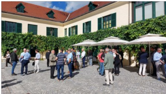
Landesgremialtagung des NÖ Weinhandels bei Winzer Kreams