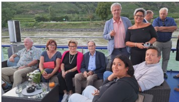
Jährlicher Branchenevent der NÖ Baustoffhändler in der Wachau