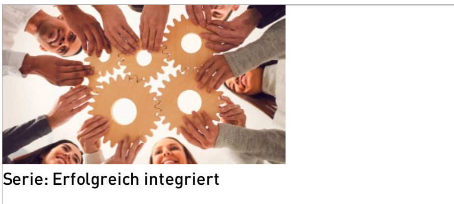
Serie: Erfolgreich integriert