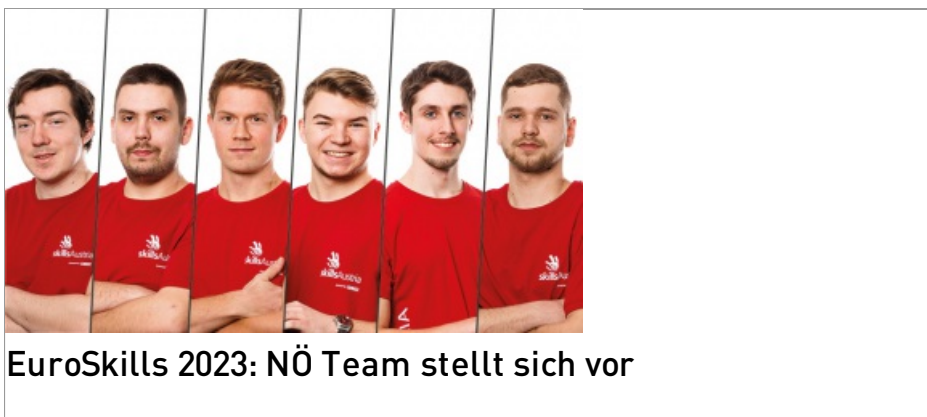
EuroSkills 2023: NÖ Team stellt sich vor