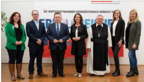
Neujahrsempfang Zwettl 2023