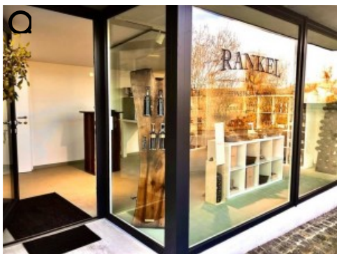
Rankel geNUSSshop in Potzneusiedl

Wir sind überzeugt, dass wir aus dieser Krise mit neuen Ideen und mit Zuversicht herauskommen werden!