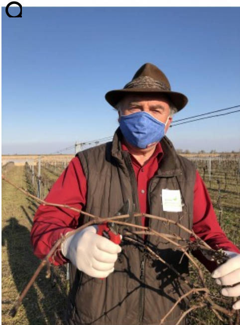
Willi Opitz mit Maske

For latest information and bookings visit www.willi-opitz.at