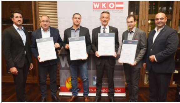
Ehrung für verdiente Unternehmer