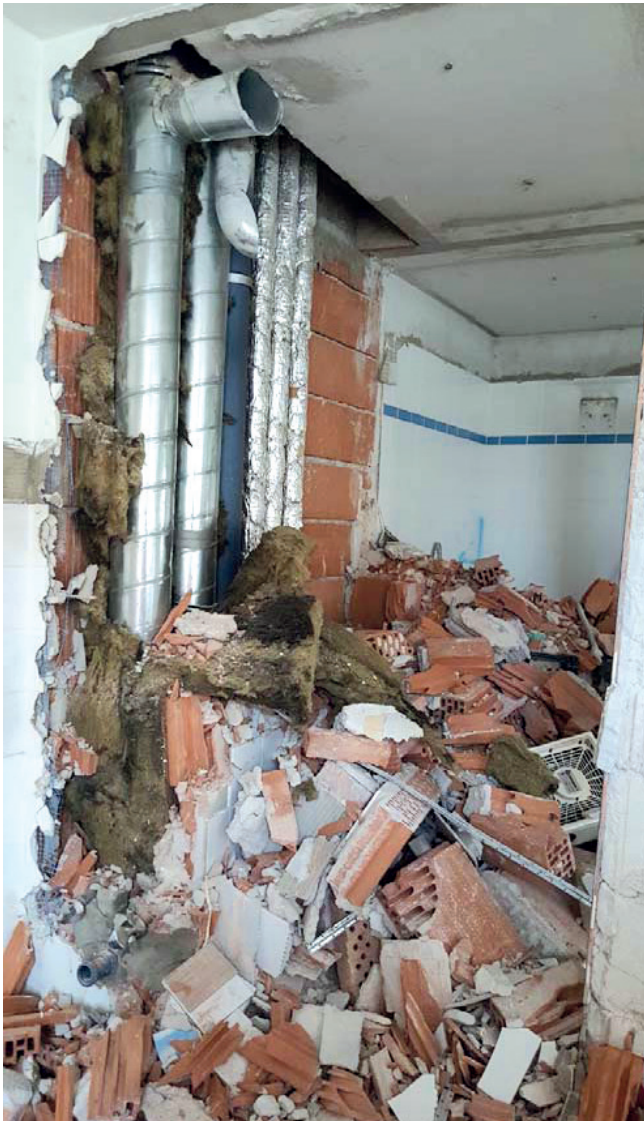
Bsp.: 5_Medienleitungen mit KMF isoliert

Ein Leitungsschacht wird abgebrochen. Dabei wird KMF-Isoliermaterial der Leitungen angetroffen. Auch die Leitungen sollen vollständig entfernt werden.