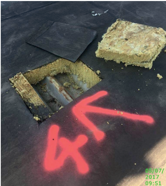
Bsp.: 3b_KMF-Dämmung unter bituminöser Abdeckung

Dachpappe aus Bitumen mit KMF-Platten verklebt, auf Trapezblech aufliegend