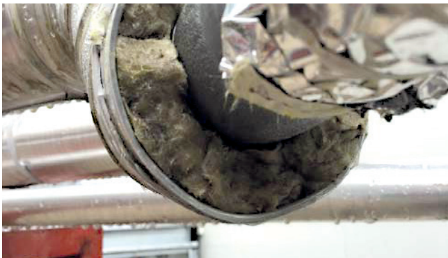
Bsp.: 2_Rohrummantelung aus KMF

Eine mit KMF ummantelte Medienleitung soll vollständig demontiert werden. Innerhalb der äußeren Ummantelung wird eine KMF-Isolierung vorgefunden, die das innen liegende Rohr vollständig umschließt.