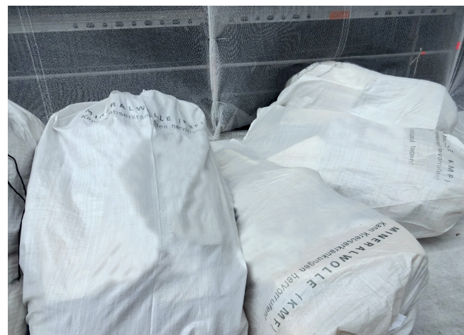
Bsp.: 10_Transportsäcke gekennzeichnet für KMF