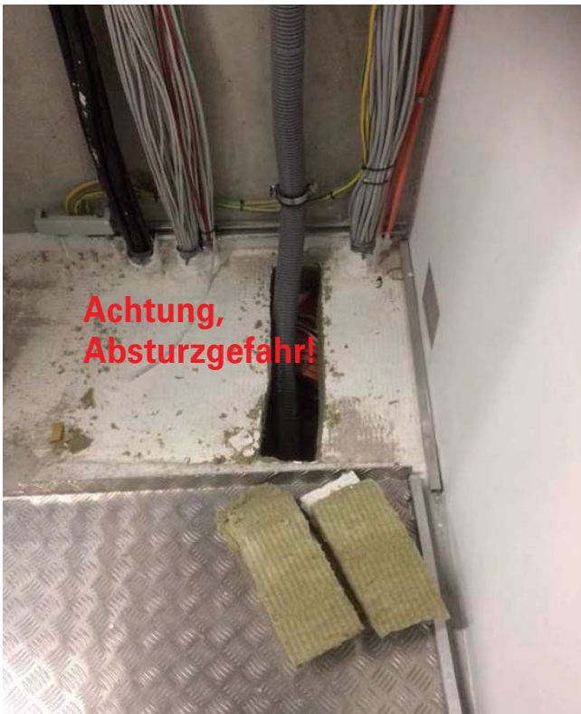
Bsp.: 9_Öffnung einer KMF-Abschottung

Abschottung von Rohrdurchführung durch Geschossdecke mittels KMF