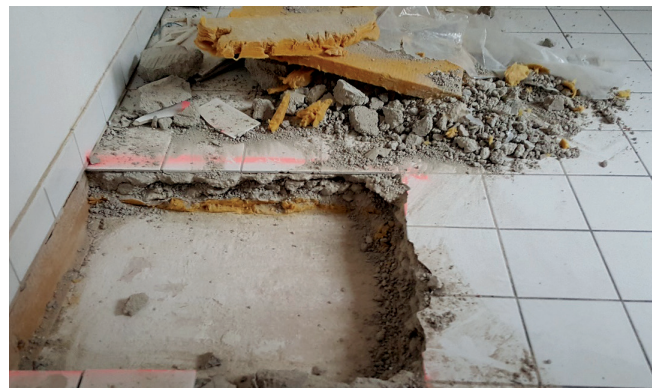
Bsp.: 4_Trittschalldämmung aus KMF

Faserfreisetzung soll die Baufolie jedenfalls erst unmittelbar vor der Entfernung der Trittschalldämmplatten entfernt werden.