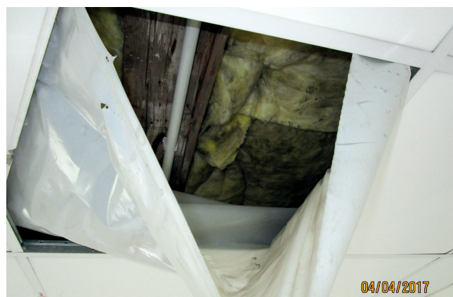
Bsp.: 8_KMF-Matten hinter abgehängter Decke