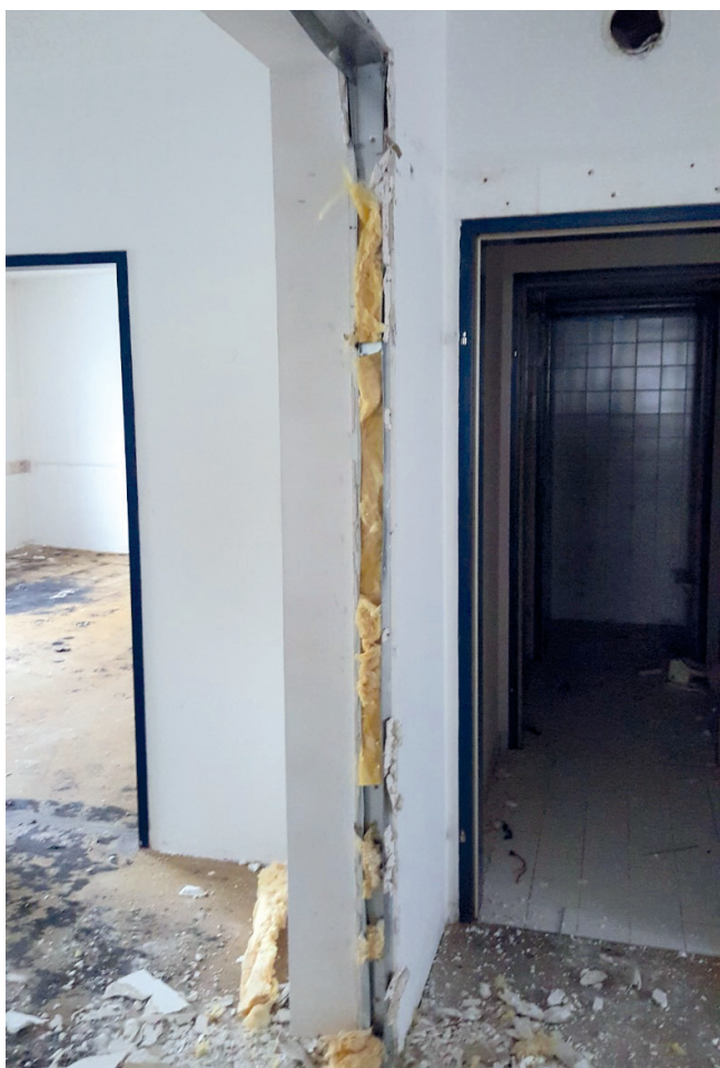
Bsp.: 7_KMF in Ständerwänden

KMF als Dämmung zwischen Gipskartonplatten zur Raumtrennung