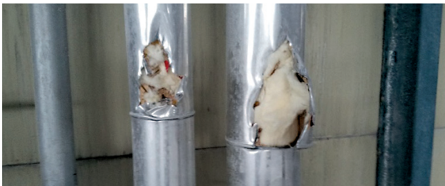
Bsp.: 1_Rohrummantelung aus KMF