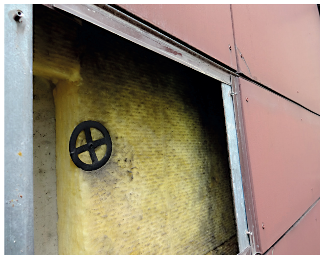
Bsp.: 3a_Außenfassade mit KMF-Dämmung