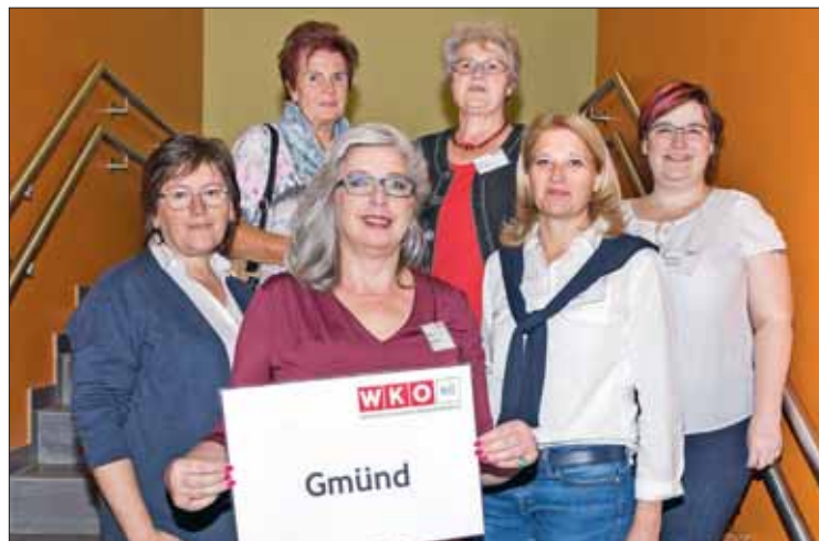
Auch die Gmünder Unternehmerinnen nutzten die Chance, sich in Schwechat zu vernetzen.