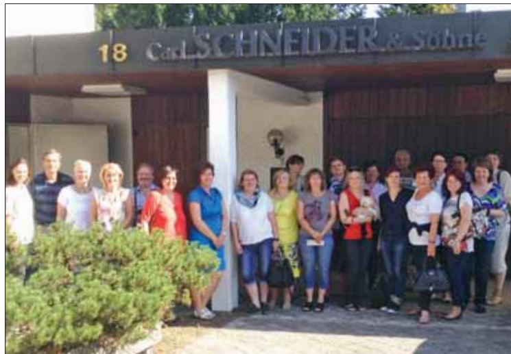
Die Delegation aus Niederösterreich erkundete Bayern – hier zu Gast beim Knopfhersteller „Schneider“ in Augsburg.

An der jüngsten Studienreise (nach Bayern) nahmen 21 Personen teil. Die „Besichtigungsziele“ waren: