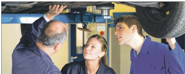
Schnupperlehre wird bei der Lehrlingssuche immer wichtiger.

Auf www.wko.at/noe/bildung finden Sie alle rechtlichen Informationen und Mustervereinbarungen Ferienzeit/Unterrichtszeit und einen Beurteilungsbogen.