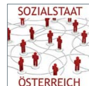
Teil 4: Gesundheit

Wesentliche Gründe für die mangelnde Effizienz: die hohe Fragmentierung der Finanzmittel und Kompetenzen sowie die Intransparenz. Unser heimisches Gesundheits- und Sozialsystem müssen wir in Zukunft vor allem an der Anzahl der gesunden und beschwerdefreien Lebensjahre messen. Dazu muss in Gesundheitsförderung, Prävention und Innovation investiert und Eigenverantwortung gestärkt werden.