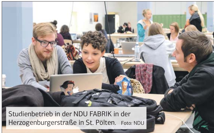
Studienbetrieb in der NDU FABRIK in der Herzogenburgerstraße in St. Pölten.