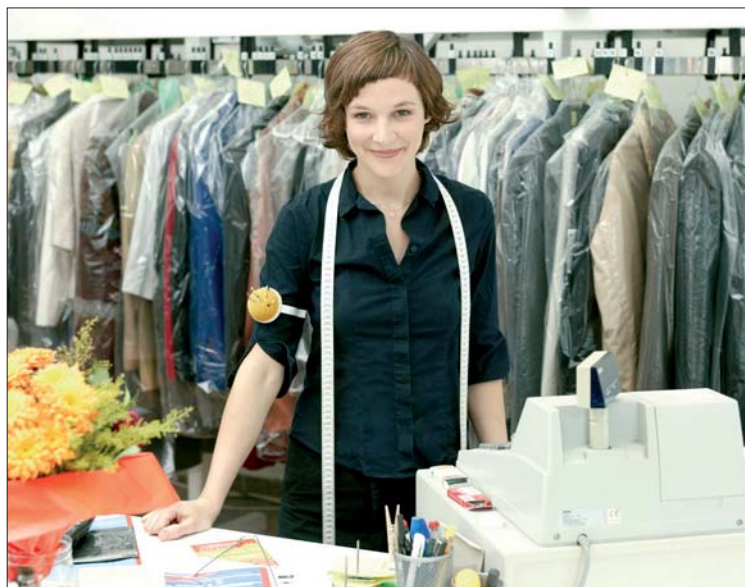
Vor allem die konsumnahen Gewerbebranchen können eine positive Entwicklung verzeichnen.

Die Branchen, die derzeit eine positive Entwicklung verzeichnen, seien vorrangig im konsumnahen Bereich zu finden.