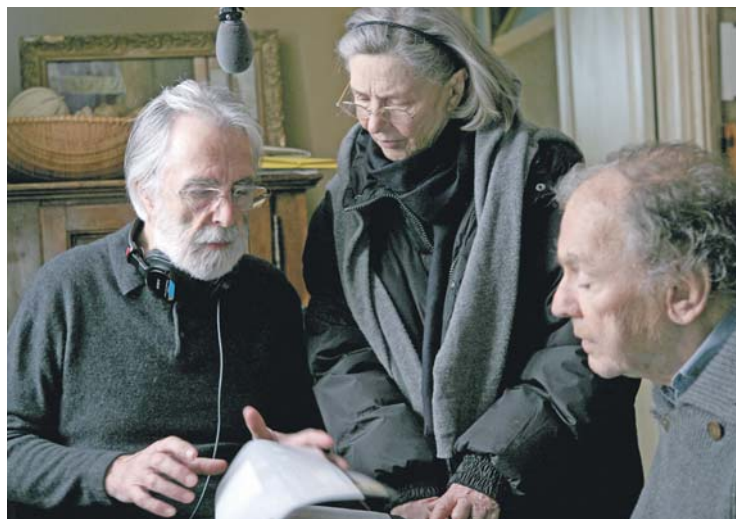
Michael Haneke, gebürtiger Wiener Neustädter und prominentes Zugpferd für die heimische Filmwirtschaft, im Gespräch mit den „Amour“-Hauptdarstellern Emanuelle Riva und Jean-Louis Trintignant