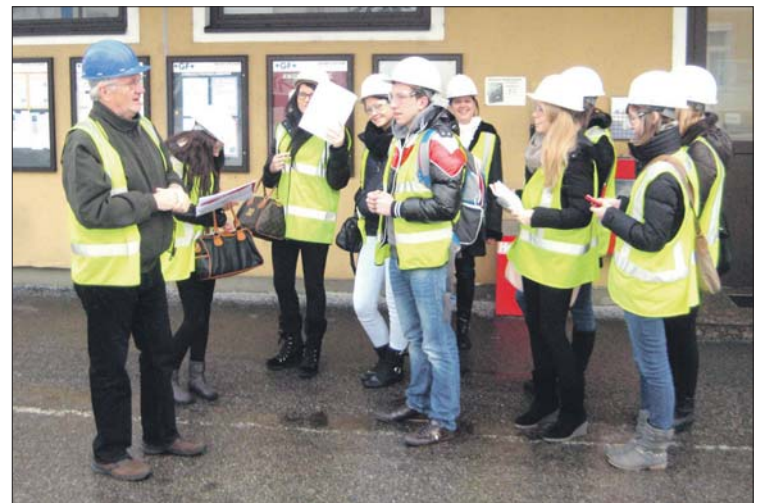
Die 3BK-Klasse der HAK St. Pölten besuchte die Firma Georg Fischer in Herzogenburg. Höhepunkt der Exkursion war die Besichtigung der Gießerei des Automobilzulieferers.

Koordiniert wird das im November 2012 gestartete Projekt „Unternehmen entdecken“ vom Regionalverband noe-mitte und der Fachhochschule St. Pölten.