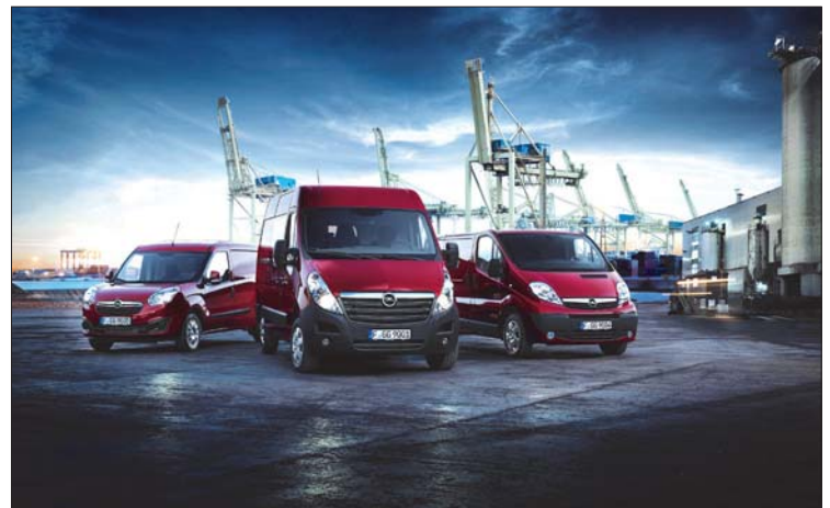
Jetzt mit 2+2 Jahre Anschlussgarantie kostenlos

Mit dem Vivaro bietet Opel einen „Allrounder“ und die beste