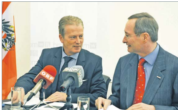
BM Mitterlehner und WKÖ-Präsident Leitl präsentierten den 5. Kreativwirtschaftsbericht.

Kreativleistungen und die damit verbundenen wissensintensiven Dienstleistungen werden als Wettbewerbsfaktor immer wichtiger. „Österreich ist nicht umsonst bei Dienstleistungen Weltspitze“, betonte Leitl. „Hier halten wir weltweit den achten Rang bei Dienstleistungsexporten. Auf diese Stärke müssen wir setzen. Die Kreativwirtschaft hat die Chance, zu einem Zugpferd zu werden