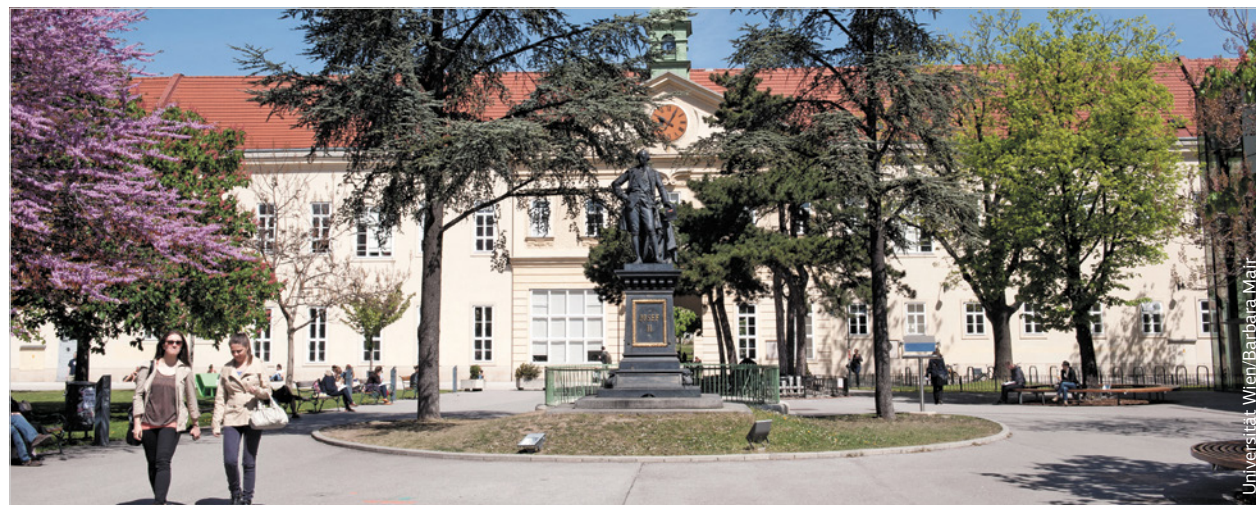
Einmal das erste Allgemeine Krankenhaus Wiens, nun der Campus der Universität Wien, der heuer in dieser Nutzung bereits sein 20-jähriges Jubiläum feiert. Mehrere tausend Menschen arbeiten und studieren hier, 16 Institute der Uni Wien sind hier untergebracht, Geschäfte und Gastro-Betriebe runden das Campus-Angebot ab.