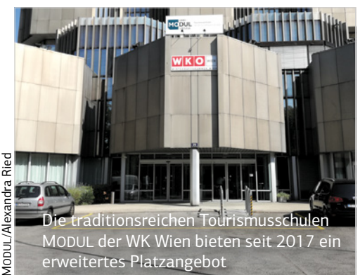
Die traditionsreichen Tourismusschulen MODUL der WK Wien bieten seit 2017 ein erweitertes Platzangebot

Sportbegeisterten ist der Sportplatz auf der Hohen Warte, Heimatstadion des Fußballclubs FC 1894, ein Begriff. Die „Vienna“ gilt als der älteste Fußballverein Österreichs.