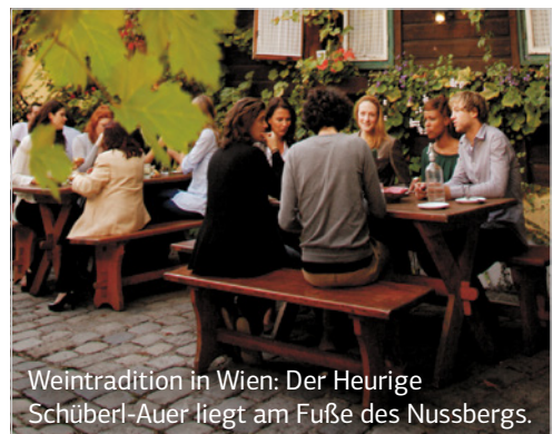
Weintradition in Wien: Der Heurige Schüberl-Auer liegt am Fuße des Nussbergs.