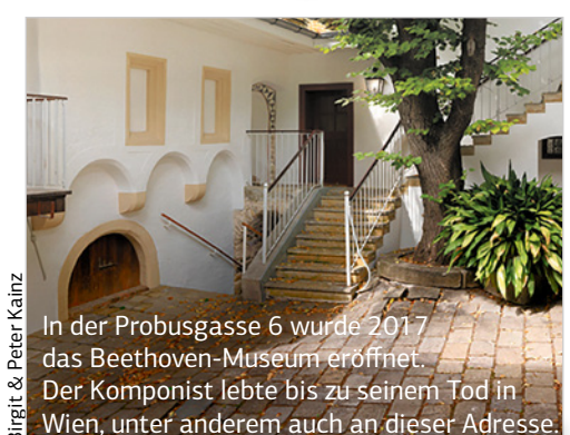
In der Probusgasse 6 wurde 2017 das Beethoven-Museum eröffnet. Der Komponist lebte bis zu seinem Tod in Wien, unter anderem auch an dieser Adresse.