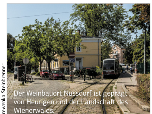
Der Weinbauort Nussdorf ist geprägt von Heurigen und der Landschaft des Wienerwalds.