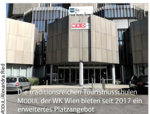
Die traditionsreichen Tourismusschulen MODUL der WK Wien bieten seit 2017 ein erweitertes Platzangebot

Sportbegeisterten ist der Sportplatz auf der Hohen Warte, Heimatstadion des Fußballclubs FC 1894, ein Begriff. Die „Vienna“ gilt als der älteste Fußballverein Österreichs.