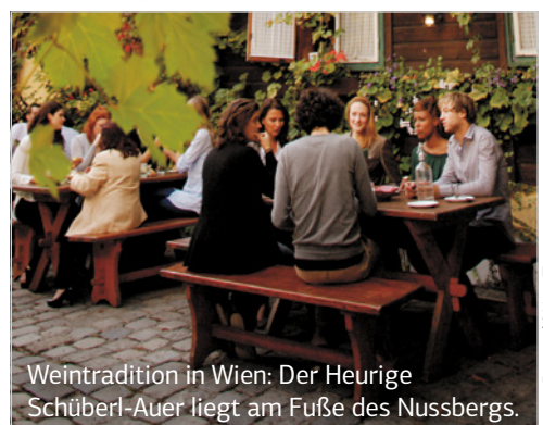
Weintradition in Wien: Der Heurige Schüberl-Auer liegt am Fuße des Nussbergs.