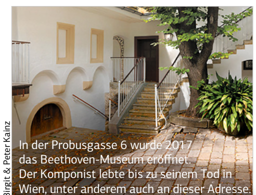
In der Probusgasse 6 wurde 2017 das Beethoven-Museum eröffnet. Der Komponist lebte bis zu seinem Tod in Wien, unter anderem auch an dieser Adresse.