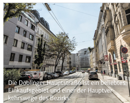
Die Döblinger Hauptstraße ist ein beliebtes Einkaufsgebiet und einer der Hauptverkehrswege des Bezirks.

Hört man „19. Bezirk“, denken viele sofort an einen Nobelbezirk mit bekannten Heurigenbetrieben. Doch Döbling kann noch sehr viel mehr. Zahlreiche Gemeindebauten wie der Karl-Marx-Hof, der als längstes zusammenhängendes Wohngebäude der Welt gilt, prägen den Bezirk ebenso wie eine lebendige Geschäftsstruktur und der große Anteil an Grünflächen, von denen der Großteil für den Weinbau genutzt wird. In Döbling steht auch