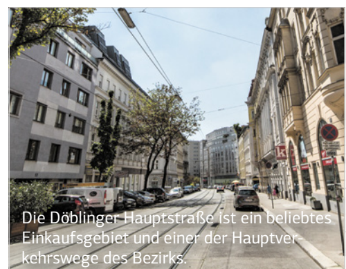
Die Döblinger Hauptstraße ist ein beliebtes Einkaufsgebiet und einer der Hauptverkehrswege des Bezirks.

Hört man „19. Bezirk“, denken viele sofort an einen Nobelbezirk mit bekannten Heurigenbetrieben. Doch Döbling kann noch sehr viel mehr. Zahlreiche Gemeindebauten wie der Karl-Marx-Hof, der als längstes zusammenhängendes Wohngebäude der Welt gilt, prägen den Bezirk ebenso wie eine lebendige Geschäftsstruktur und der große Anteil an Grünflächen, von denen der Großteil für den Weinbau genutzt wird. In Döbling steht auch