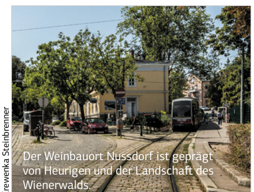
Der Weinbauort Nussdorf ist geprägt von Heurigen und der Landschaft des Wienerwalds