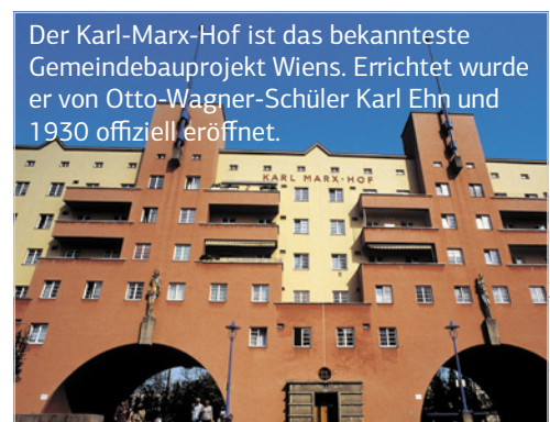
Der Karl-Marx-Hof ist das bekannteste Gemeindebauprojekt Wiens. Errichtet wurde er von Otto-Wagner-Schüler Karl Ehn und 1930 offiziell eröffnet.