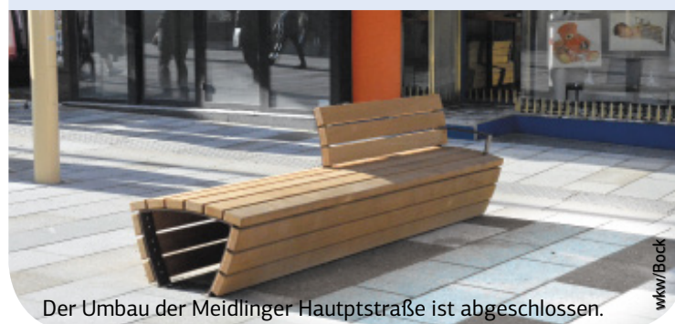
Der Umbau der Meidlinger Hauptstraße ist abgeschlossen.

Spielflächen gibt es. Damit ist der Bezirk Spitzenreiter in Wien.