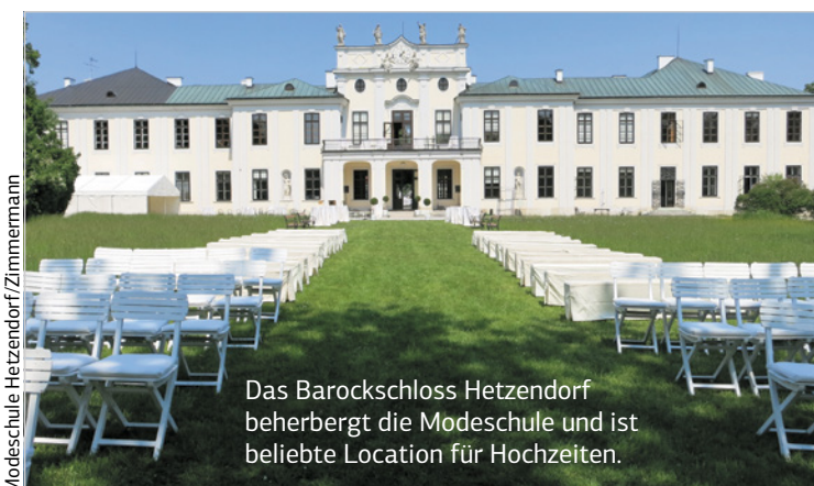
Das Barockschloss Hetzendorf beherbergt die Modeschule und ist beliebte Location für Hochzeiten.