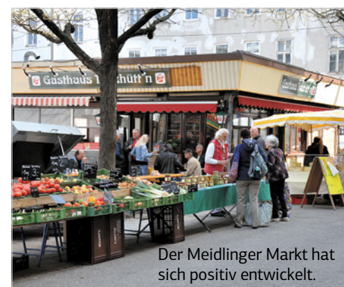
Der Meidlinger Markt hat sich positiv entwickelt.

Der Anteil an Grünfläche ist zwar gering, aber dafür noch reich an Tier- und Pflanzenarten. Die gute Öffi-Anbindung durch den Bahnhof, die U4 aber auch viele Busse und Bime erleichtert die Nahversorgung der Bevölkerung. Beim ansässigen Einkaufsstraßenverein „Einkauf in Meidling“ engagieren sich große Kaufhäuser genauso, wie kleine Spezialisten. Der Meidlinger Markt hat sich in den letzten Jahren vom Geheimtipp zum gut frequentierten Einkaufsgebiet mit einigen interessanten Lokalen entwickelt. Dementsprechend sind die Top drei Branchen in der Erdgeschos-Zone der Lebensmittelhandel, der Elektro-einzelhandel und der Bekleidungshandel.