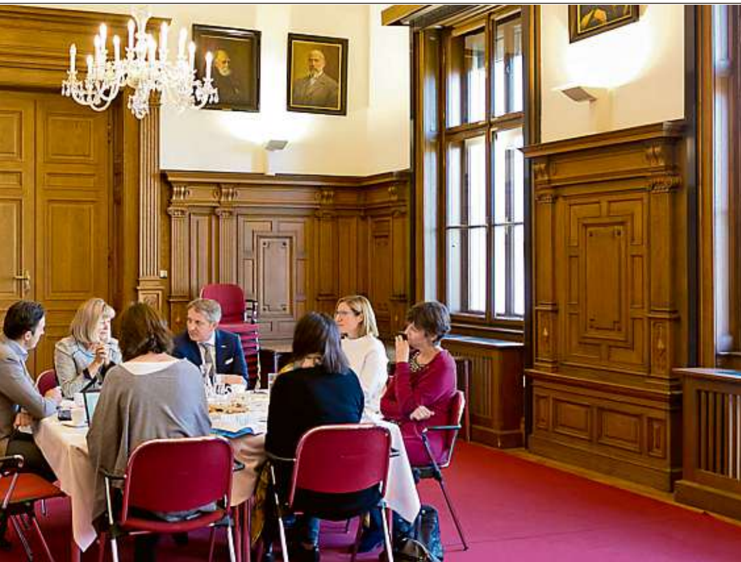
Vorfeld des Karrierefestivals Excellence 2017 an der Uni Graz