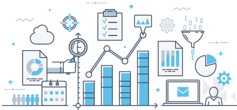
CHART OF THE WEEK