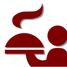
Fördercall „Gastgeber 2019“